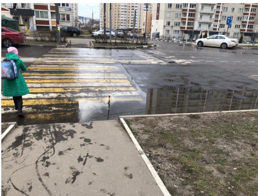
Фото 2 (апрель 2019)