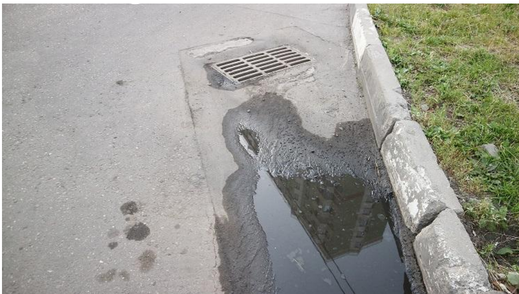
Фото 5 (июнь 2019)