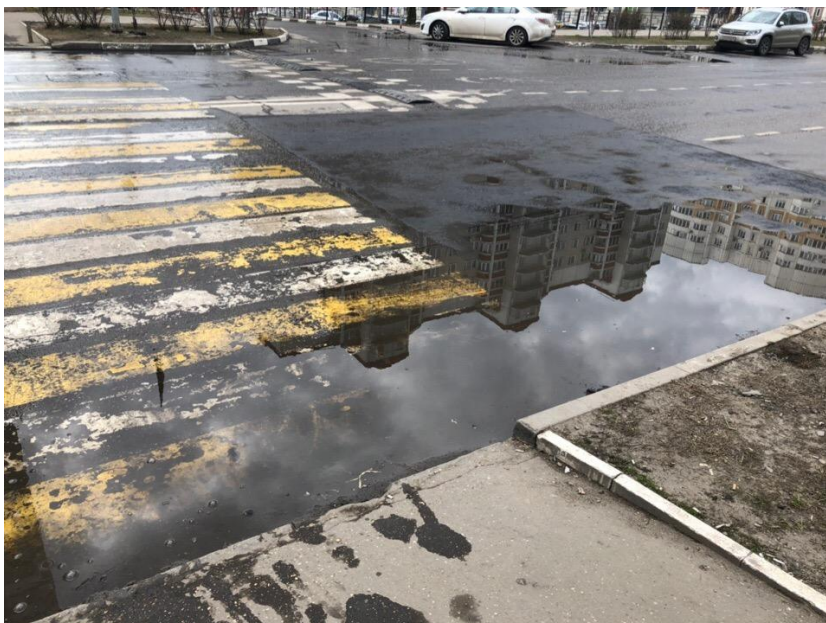
Фото 1 (апрель 2019)