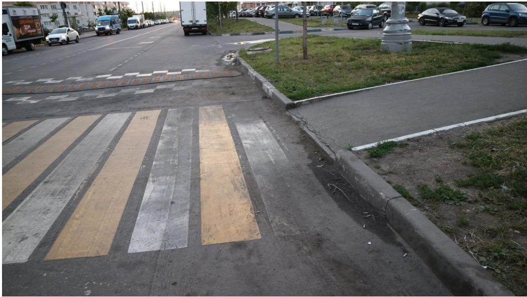
Фото 3 (июнь 2019)