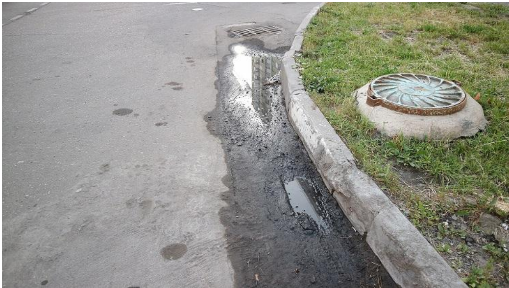
Фото 4 (июнь 2019)